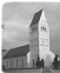
St. Margareta Hohenried