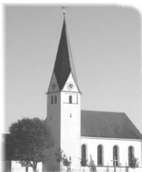
St. Michael Brunnen