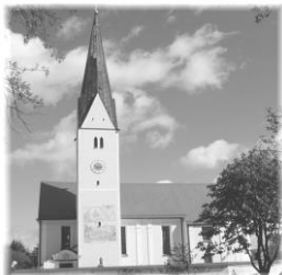
Mariä Reinigung & St. Wendelin Waidhofen